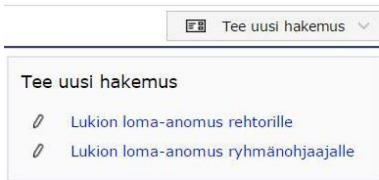
Kuva 1. Hakemuksen tekeminen

Hakemuslomakkeet näkyvät Wilman Hakemukset ja päätökset -välilehdellä kohdassa Tee uusi hakemus .